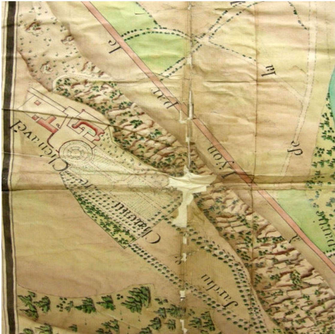
Plan de la propriété de Chenavel au XVIIIe siècle-Archives départementales de l'Ain, 100 Fi 1350, partie