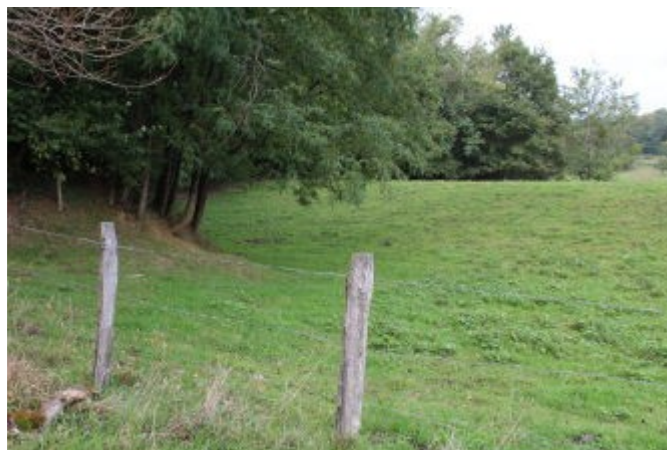
Ancienne fouille à la Carronnière d'en Haut