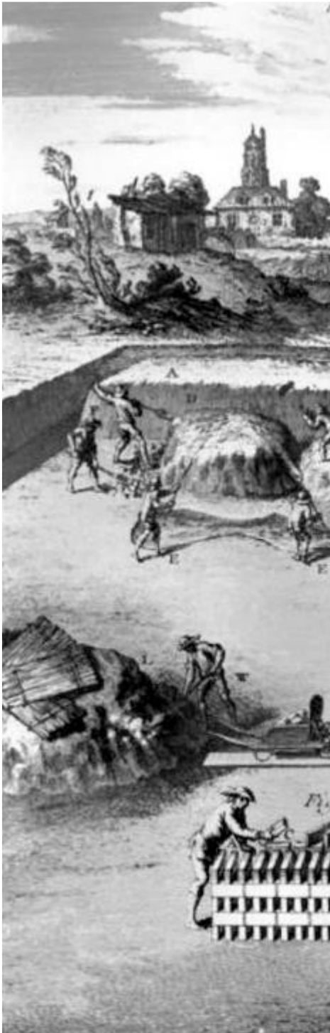
Planche extraite de L'art du tuilier et du briquetier – Préparation des briques (ou des tuiles)