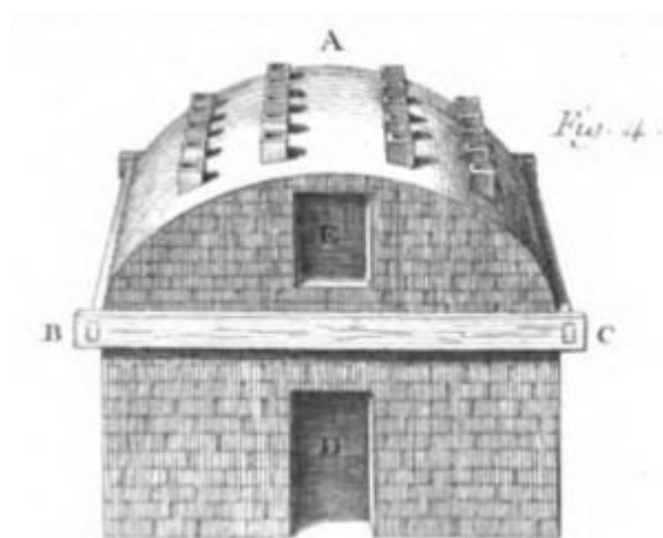
Four fermé – Extrait de planche de l'art du tuilier

Les cycles de fabrication des tuiles ou celui des briques sont quasiment identiques. On fouille la terre en hiver, de sorte que les gelées la disloquent, la foisonnent. La mauvaise terre est triée et mise de côté. Celle retenue est tamisée pour éliminer les petits cailloux. Après quoi elle est arrosée et remuée. Puis les ouvriers la corroient avec les pieds et leurs outils. Battue avec le dos de la pelle et lissée, elle est enfin prête. En attendant le moulage on la protège de la déshydratation par des paillassons. Le mouleur travaille sur une table où est placé le moule maintenu mouillé, le sable fin et un tas de terre à employer. Une fois rempli de pâte compactée, le moule est arasé avec un archet. Après avoir relevé le crochet de la tuile ou percé les trous de clouage, les tuiles sont emportées dans la halle pour sécher à plat pendant un ou deux jours. Lorsqu'elles sont devenues rigides, le séchage se poursuit « sur champ », rangées en « haies » pour une moindre place. La halle est de dimensions suffisante pour recevoir plusieurs dizaines de milliers de tuiles qui attendent la cuisson.