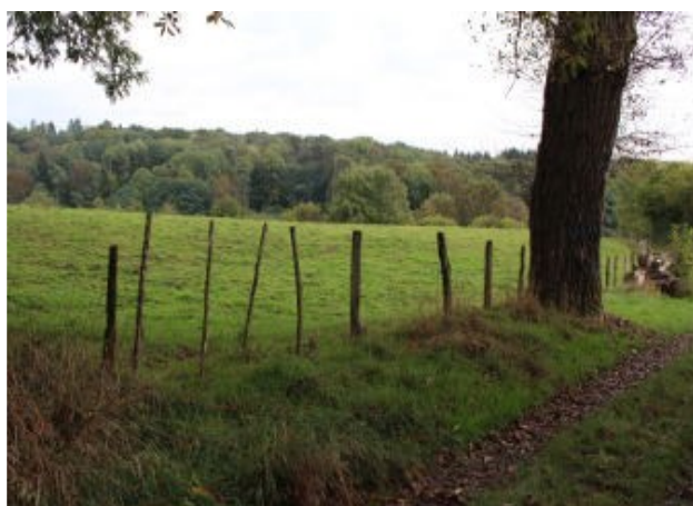
Lieu-dit « La Carronnière », en haut.