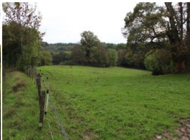
Lieu-dit « La Carronnière », en bas.

La tuilerie, ou carronnière de Chenavel se compose donc, à la fin du XVIII e siècle, d'un ensemble foncier de près d'un hectare et demi, traversé par un chemin allant de Chenavel aux Millières, l'actuel GR59. Ces parcelles ont été cadastrées en 1825 sous les N° 2047 et 1619 dans la section A, 4e feuille.