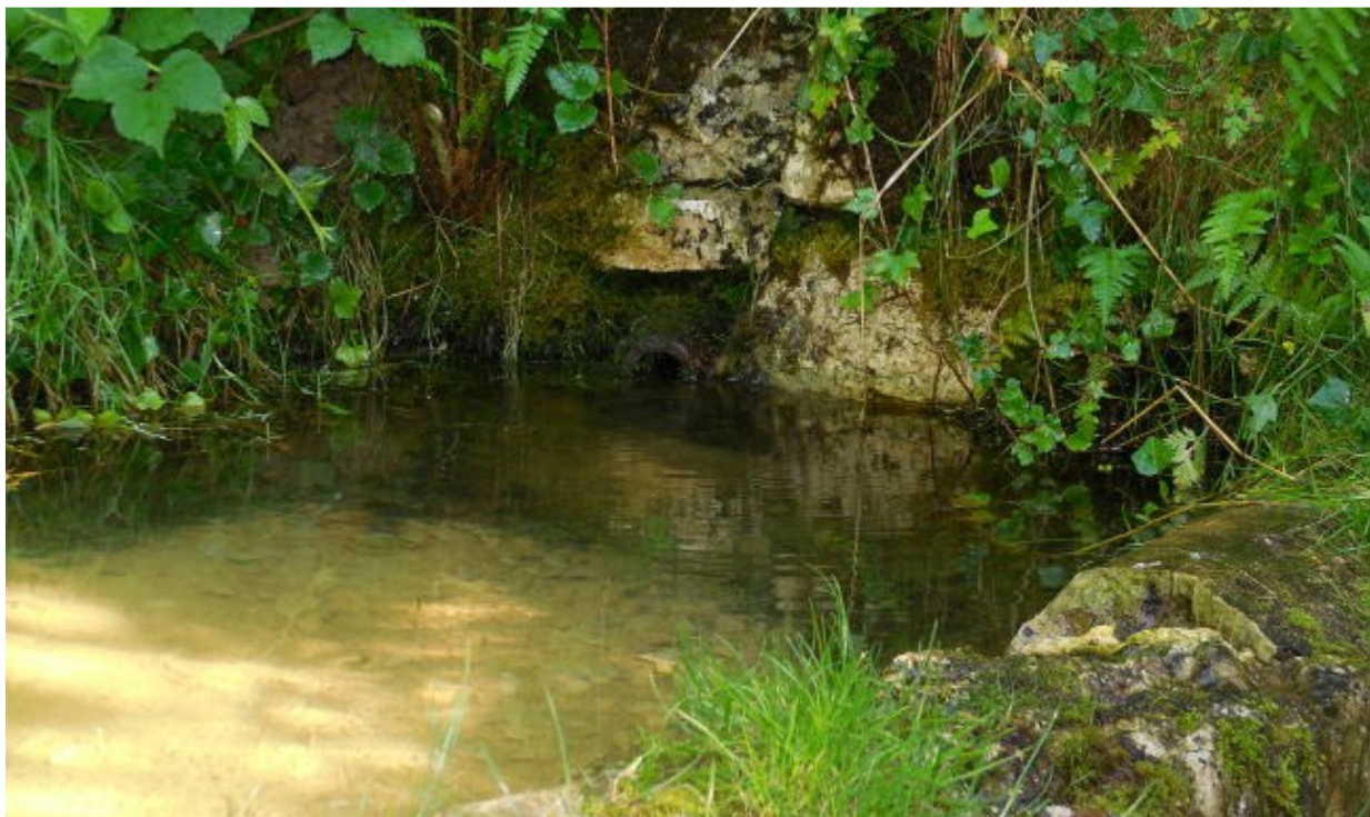
Source captée et son bachat