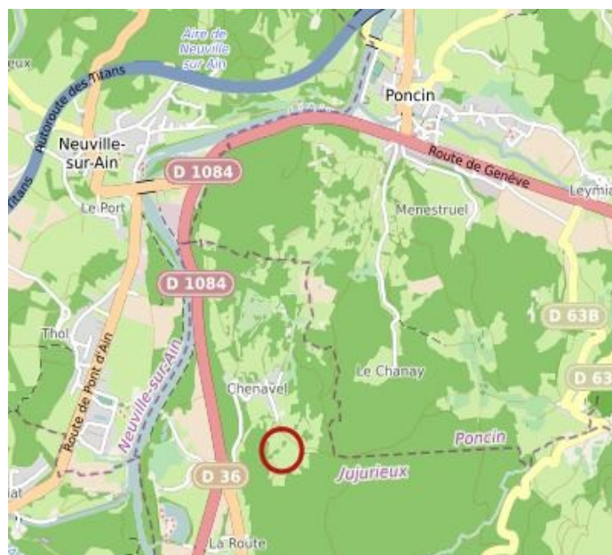
Situation de La Carronnière de Chenavel

Suite aux recherches entreprises dans les archives par quelques personnes, dont nous-même, est venu le temps de réaliser la synthèse des connaissances, vérifier les hypothèses et certains points encore obscurs et peut-être avancer vers plus de clarté. Mais voyons en premier lieu la consistance d'une tuilerie aux XVII e et XVIII e siècles, et quels sont les critères nécessaires à son implantation.