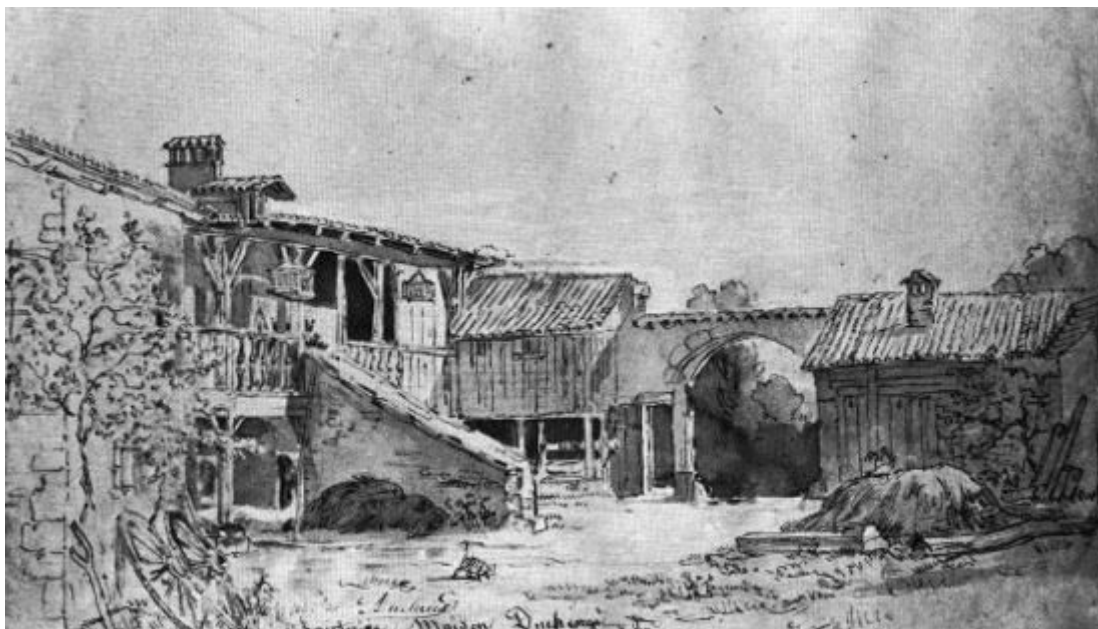
"Maison Duchenai à Hauterive" 220 x 390 mm - Source : Visages de l'Ain, juillet-août 1979, actuelle rue du Puits

À partir de 1836 il associe à la peinture la technique du dessin et des eaux fortes. Vers 1860 Ingres se prend d'admiration devant ses gravures. Celui-ci le présente comme correspondant de l'Institut où il fut admis le 25 juillet 1863.