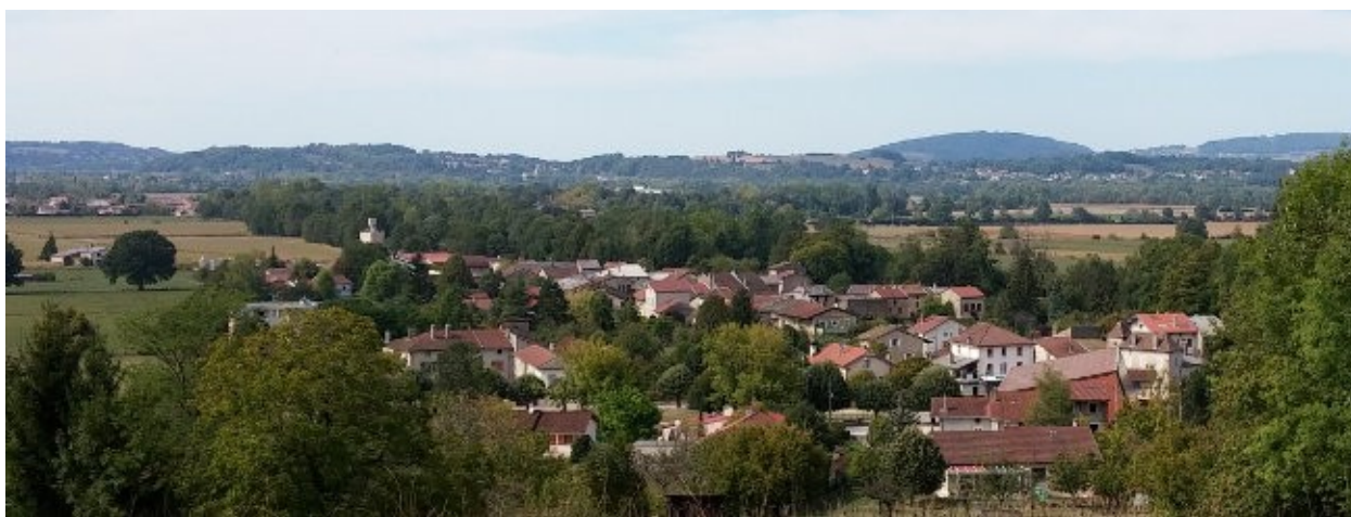
Le quartier du Mermand et de la vallée de l'Ain, vus depuis Saint-Cyr

Aujourd'hui Saint-Cyr n'est qu'un lieu-dit assez banal de la commune de Saint-Jean-le-Vieux, situé sur le coteau à l'est de la route de Lyon, à la sortie sud du village. Le site alentour présente quelques points de vue pittoresques sur l'agglomération, les collines de Jujurieux et la plaine de l'Ain.