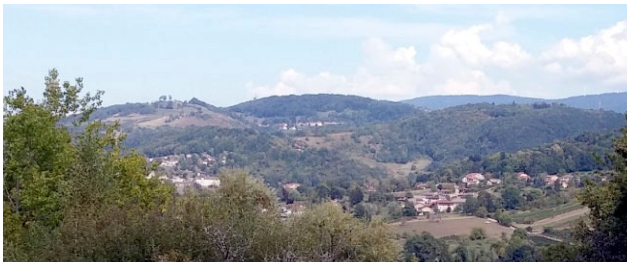
Dessin 1: Jujurieux, Chaux et le quartier de la Fontaine à Varey, vus de la colline de St-Cyr

dement de Varey 20 . Les terres du lieu Saint-Cyr sont déjà morcelées, car plusieurs propriétaires s'échangent des parcelles, dont on relève plusieurs actes notariés. Celles attenantes à l'ancien prieuré demeurent. En 1676, le seigneur de Varey alberge à Mr GALIEN de La Chaux les eaux sortant de la fontaine collective, appelée fontaine de Saint-Cyr, pour arroser son pré du Closeau 21 d'une surface de huit seytives , soit près de 2 hectares.