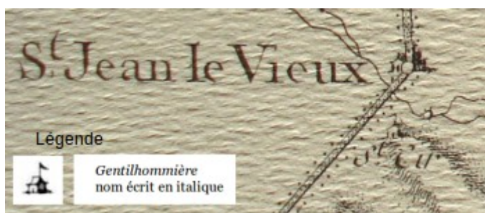
Extrait de la carte de Cassini