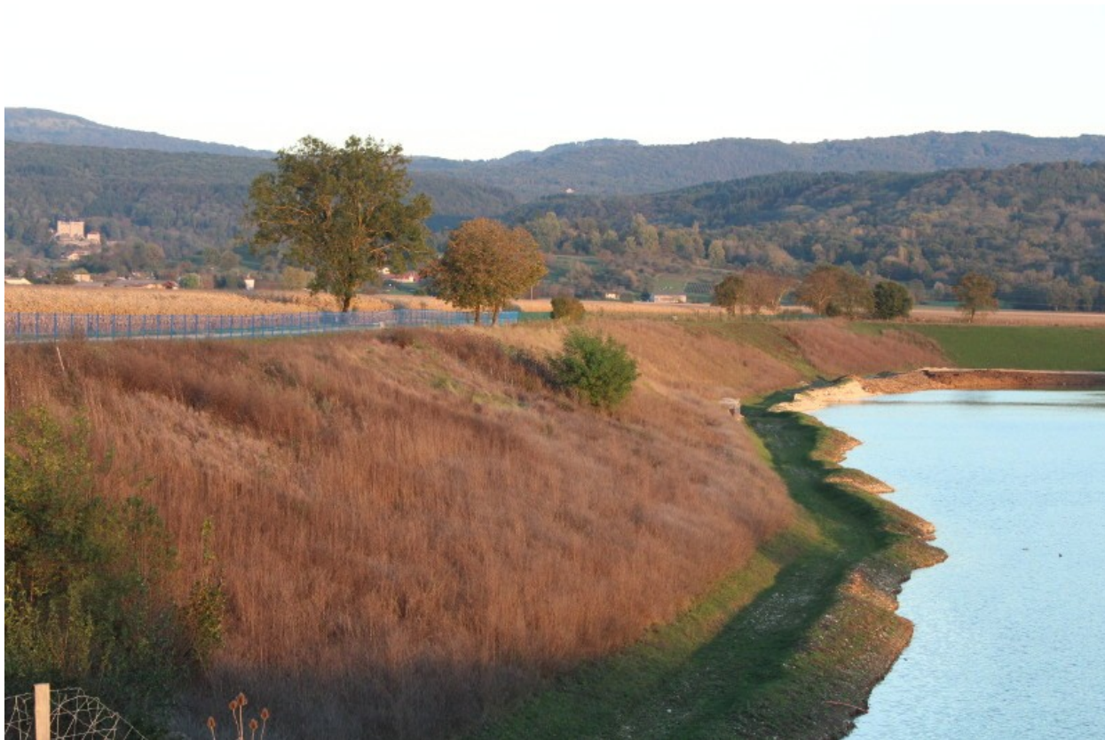
Le lieu dit « Sur le Mollard » est transformé en gravière-Photo de 2014